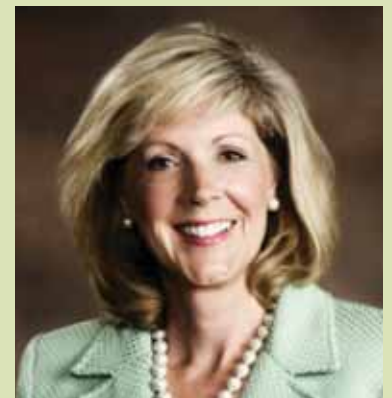
Mabrie Jackson Place 3