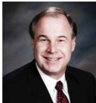
Scott Johnson Place 2